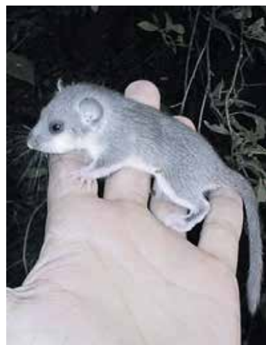
Ob dotiku se polh takoj zbudi.