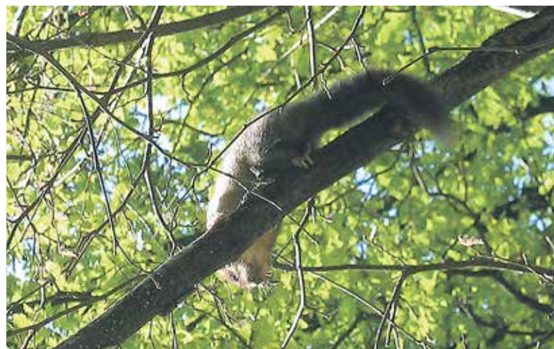
Polhi so najraje v gozdu in živijo v duplinah in pod zemljo.