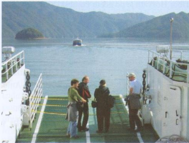
Po velikem umetnem jezeru smo se popeljali z ladjo v spremstvu novinarskega čolna.

Šele na izletu v gorato demilitarizirano cono na meji med obema Korejama, državama z enim narodom, ki je še vedno na silo ločen s tremi pasovi bodečih ograj, smo doumeli, čemu veliki transparenti »VIDRA - AMBASADORKA MIRU«, ki so nas sprejeli ob prihodu v Hwacheon. Žične ograje namreč preprečujejo ljudem in živalim, da bi prehajali mejo med državama; edine prebežnice, ki lahko potujejo po rekah s severa proti jugu, torej iz Severne v Južno Korejo in obratno, so vidre. Zato so postale ambasadorke miru, skritih želja številnih družin, ki se niso srečale že nekaj desetletij in ki nimajo nobenih stikov. V teh spretnih, igrivih živalih, ki ne poznajo političnih meja, Korejci vidijo upanje na mir in ponovno združitve razdeljene dežele. Ob tem postane nesorazmerno velika medijska pozornost, ki smo je bili deležni strokovnjaki za vidre z vsega sveta, bolj razumljiva.