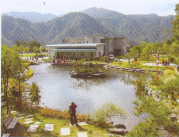
Na meji med obema Korejama nastaja park miru, ki bo tudi zavarovano območje narave

Sredi letošnjega oktobra je Hwacheon, majhno mesto v Južni Koreji, za dober teden postal središče sveta - vsaj za strokovnjake, ki se ukvarjajo z raziskovanjem in ohranjanjem različnih vrst vider. Na mednarodni kolokvij o vidrah, že 10. po vrsti, kjer se srečujejo nacionalni predstavniki Skupine strokovnjakov za vidre pri IUCN/SSC (Komisiji za ohranitev vrst pri Svetovni zvezi za ohranitev narave), je pripotovalo več kot 150 udeležencev z vsega sveta, tudi iz Slovenije.