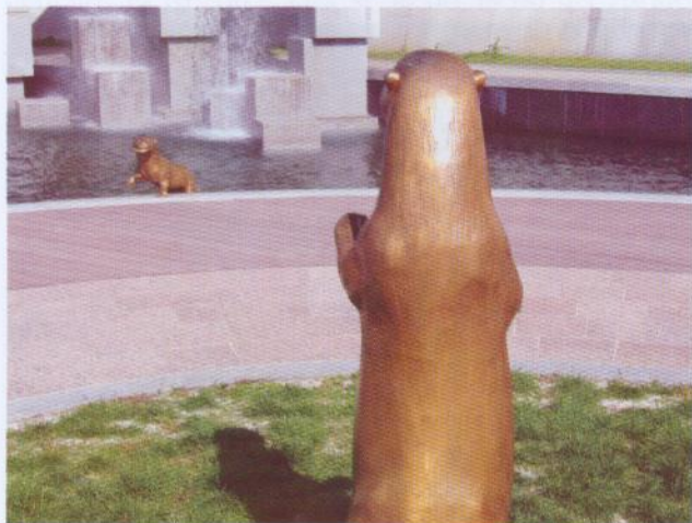
Bronaste skulpture vider v parku miru.

Ob odličnih zgledih iz Koreje to ne bo lahek zahtoj. Na projektu LIFE nas v prihodnjem letu čaka še veliko nalog, med katerimi je zagotovo najpomembnejša gradnja in oprema Vidrinega centra, ki ga bomo predstavili prihodnjič. Veseli bomo, če boste občani pri tem želeli sodelovati